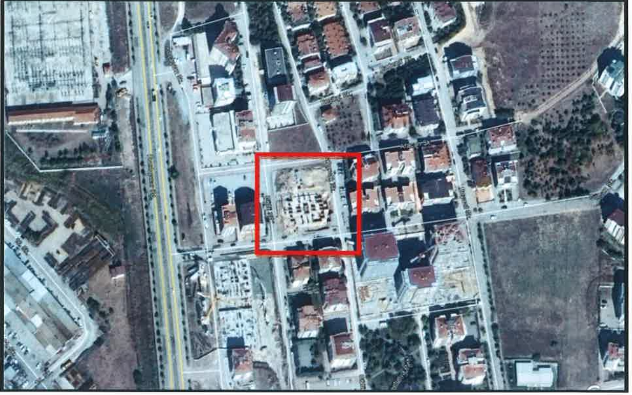
Şekil 2: Planlama Alanının Ulaşım İlişkileri