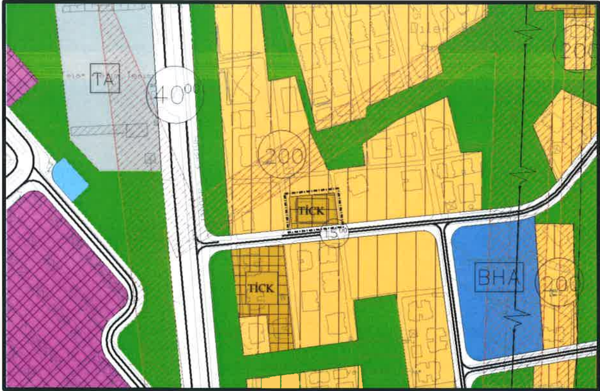
Şekil 5: 731 Ada 1 Sayılı Parsele İlişkin 1/5000 Ölçekli Nazım İmar Planı Tadilatı

Bursa Büyükşehir Belediye Meclisi'nin 21.02.2017 tarih ve 460 sayılı kararıyla onaylanan plan değişikliği öncesinde planlama alanına ait parsel 1/5000 Ölçekli Nazım İmar Planında Konut Alanı imarlıdır. Parselde kentsel dönüşüm çalışması devam etmekte olup; planlama aşamasında 1/5000 ölçekli nazım imar planı değişikliği ile 1/1000 ölçekli uygulama imar planı değişikliği birlikte onaylanmıştır. Plan değişikliğine ilişkin mahkeme süreci devam etmekte olup, planlama hiyerarşisinin bozulmaması amacı ile parsel 1/5000 ölçekli nazım imar planında tekrar Ticaret-Konut Alanı olarak planlanmıştır. Yapılan değişiklik mevzuat açısından uygunluk taşımaktadır.