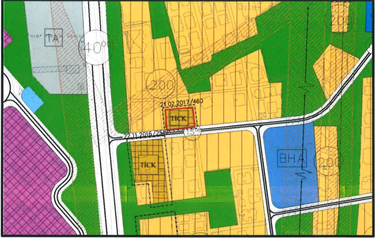
Şekil 4:1/5000 ölçekli Nazım İmar Planı Durumu

Planlama alanına ait planlama kararları incelendiğinde 1/5000 Ölçekli Nilüfer Nazım İmar Planında planlama alanı Ticaret Konut Alanı olarak planlıdır.